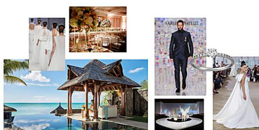
LE PRIME NOMINATION AGLI...