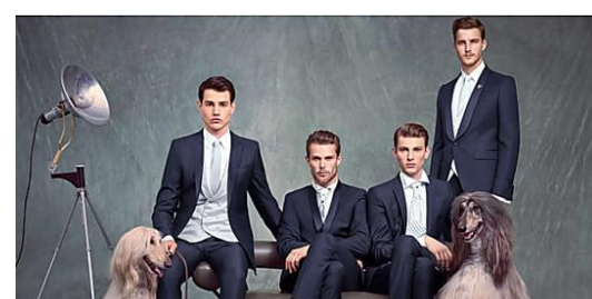
LA COLLEZIONE SARTORIAL...